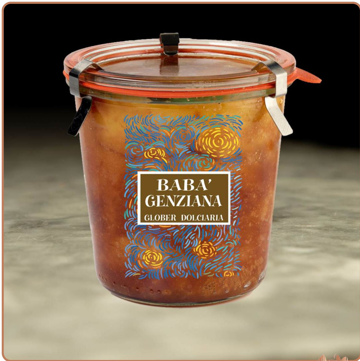
Babà in vasocottura alla Genziana