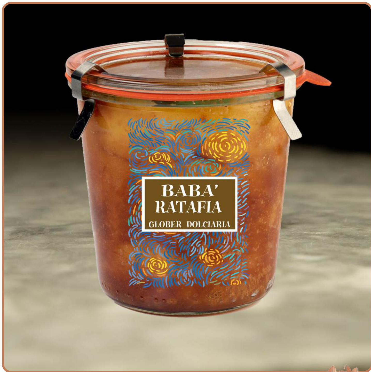
Babà in vasocottura alla Ratafia